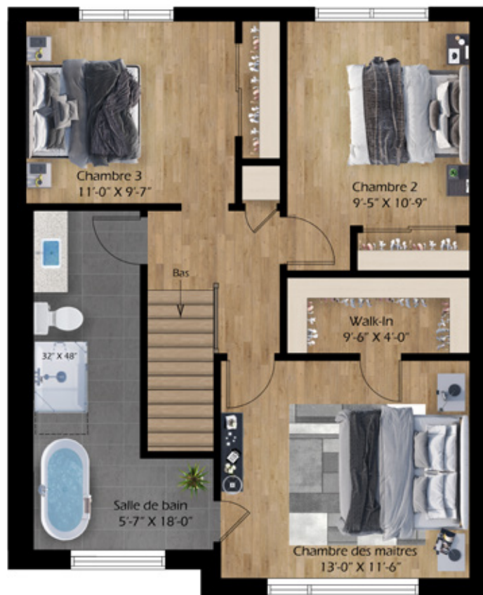
3 CHAMBRES • 1 SALLE DE BAIN

est calculée à la face extérieure des murs extérieurs, au centre des cloisons mitoyennes et au centre des murs. Cette méthode de calcul diffère de celle résultant de l'arpentage et du plan de cadastre au plan de cadastre étant toujours moindres que celles indiquées aux plans d'architecture. Ces caractéristiques prévalent sur les plans et peuvent changer sans préavis en raison des conditions de indicatif seulement. Les plans de plancher peuvent inclure certaines options. Voir la liste des spécifications à ce sujet. Pour les unités de centre, les fenêtres sur les murs latéraux sont exclues.