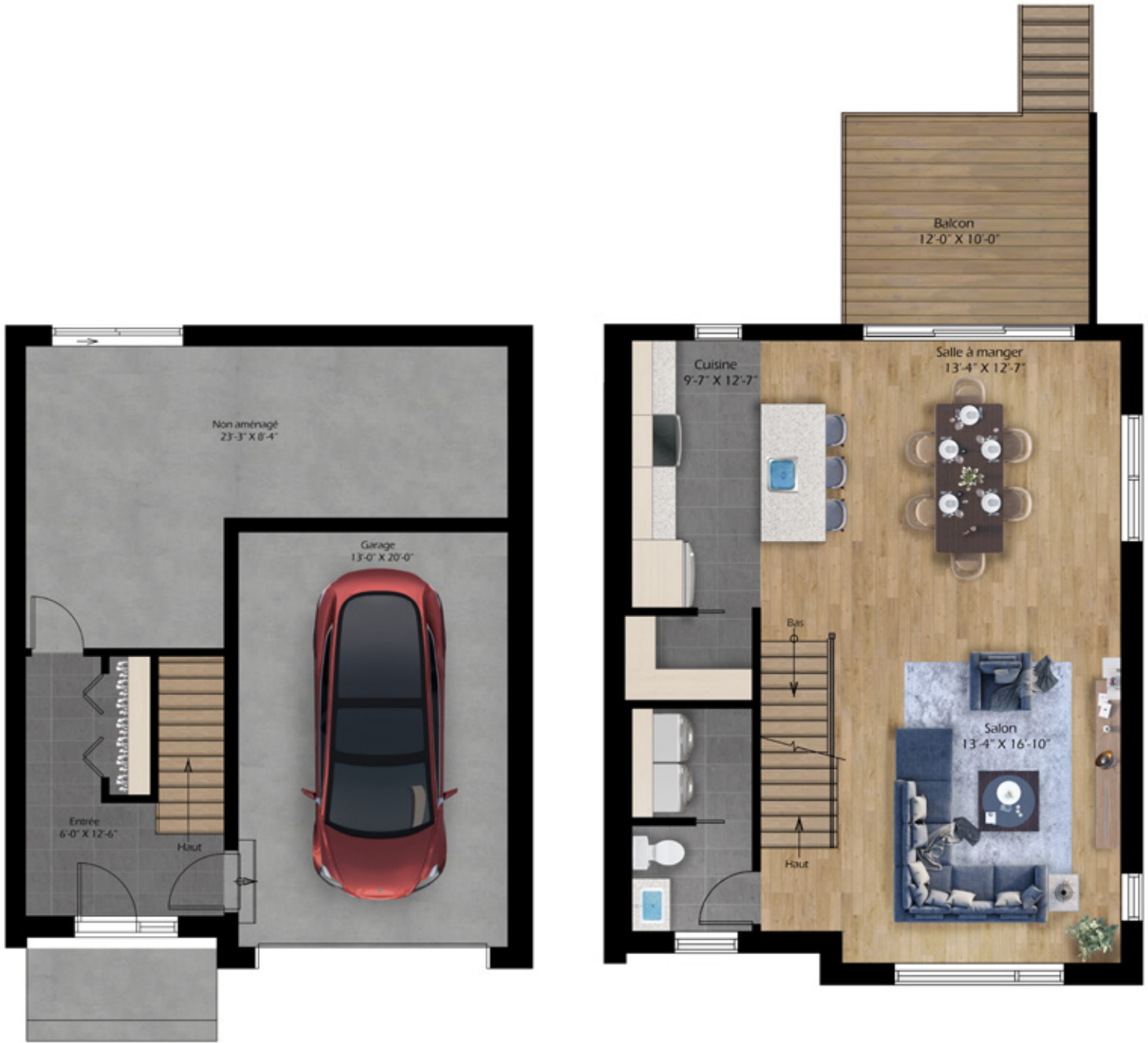
GARAGE • SALLE FAMILIALE